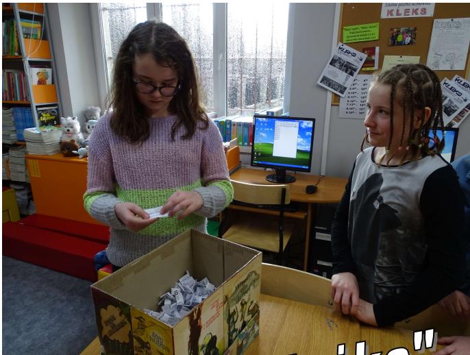
"Ferie z książką" s.8