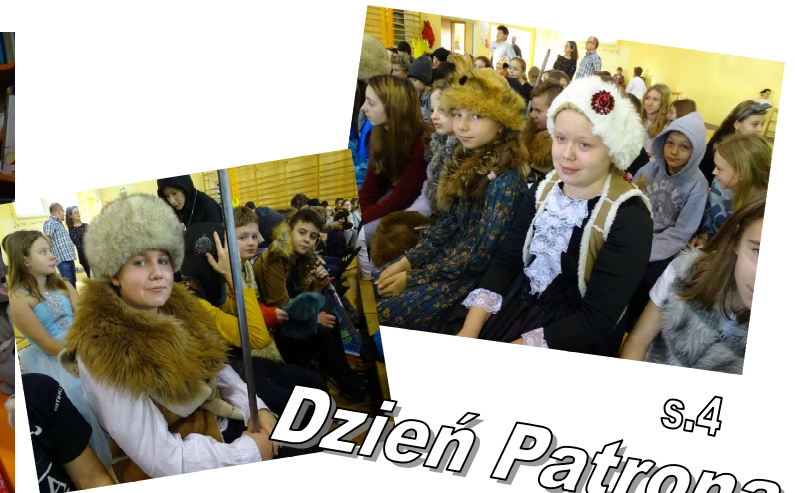
s.4 Dzień Patrona

Poszukujemy młodych twórc Jeżeli lubisz pisać wiersze chętnie opublikujemy Twoje prace w szkolnej gazecie „Kleks”. Poszukujemy pisarzy w każdym wieku, piszących na każdy temat. Jeżeli zaciekało cię ogłoszenie zapraszamy do biblioteki szkolnej.