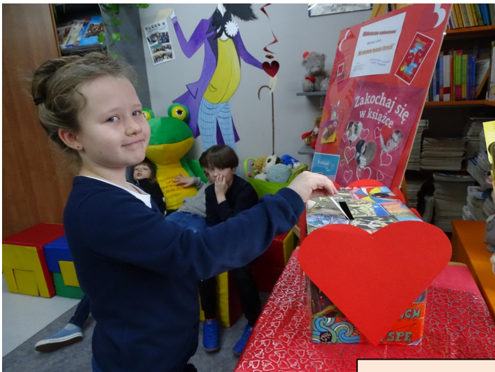
s.2 Walentynki w naszej bibliotece